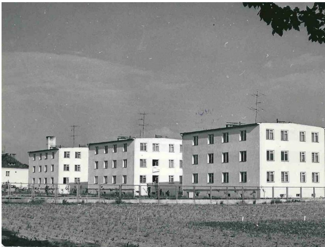
Zdjęcie 7 Nowo oddane bloki dwunastorodzinne. (Rok 1975)