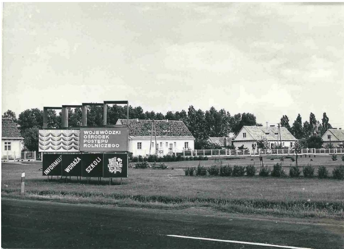
Zdjęcie 1 Widok na reklamę WOPR Minikowo z DK10 (rok 1973).

Jest to wieś w Polsce oddalona zaledwie o 19 km od stolicy województwa kujawsko-pomorskiego Bydgoszczy oraz 11 km od Nakła nad Notecią. Minikowo leży w powiecie nakielskim. Trafić do nas najłatwiej drogą krajową nr 10.