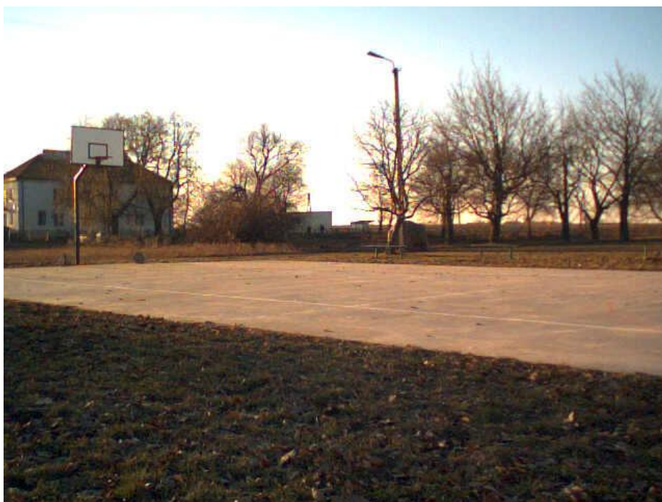
Zdjęcie 15 Nowo powstałe boisko do kosza i siatkówki. (Rok 2003)