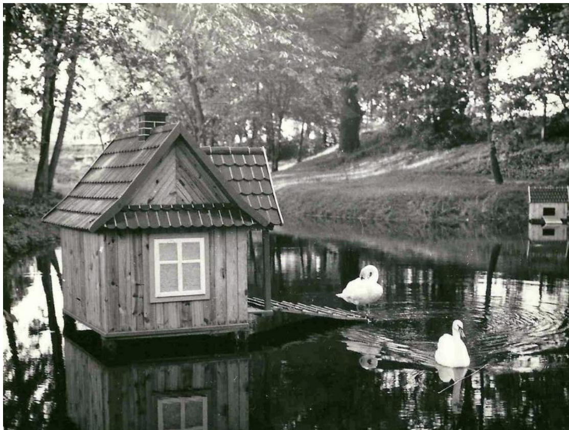
Zdjęcie 6 Trzeci stawek, po aranżacji projektantów. (Rok 1975)

W latach 74-78, wieś pięknieje i rozrasta się. Dzięki ówczesnemu dyrektorowi Ryszardowi Kamińskiemu, wieś zyskuje na estetyce. Architekci krajobrazu projektują aleje parkowe, a na stawku umieszczone zostają domki dla ptactwa wodnego ( Zdjęcie 6 ).