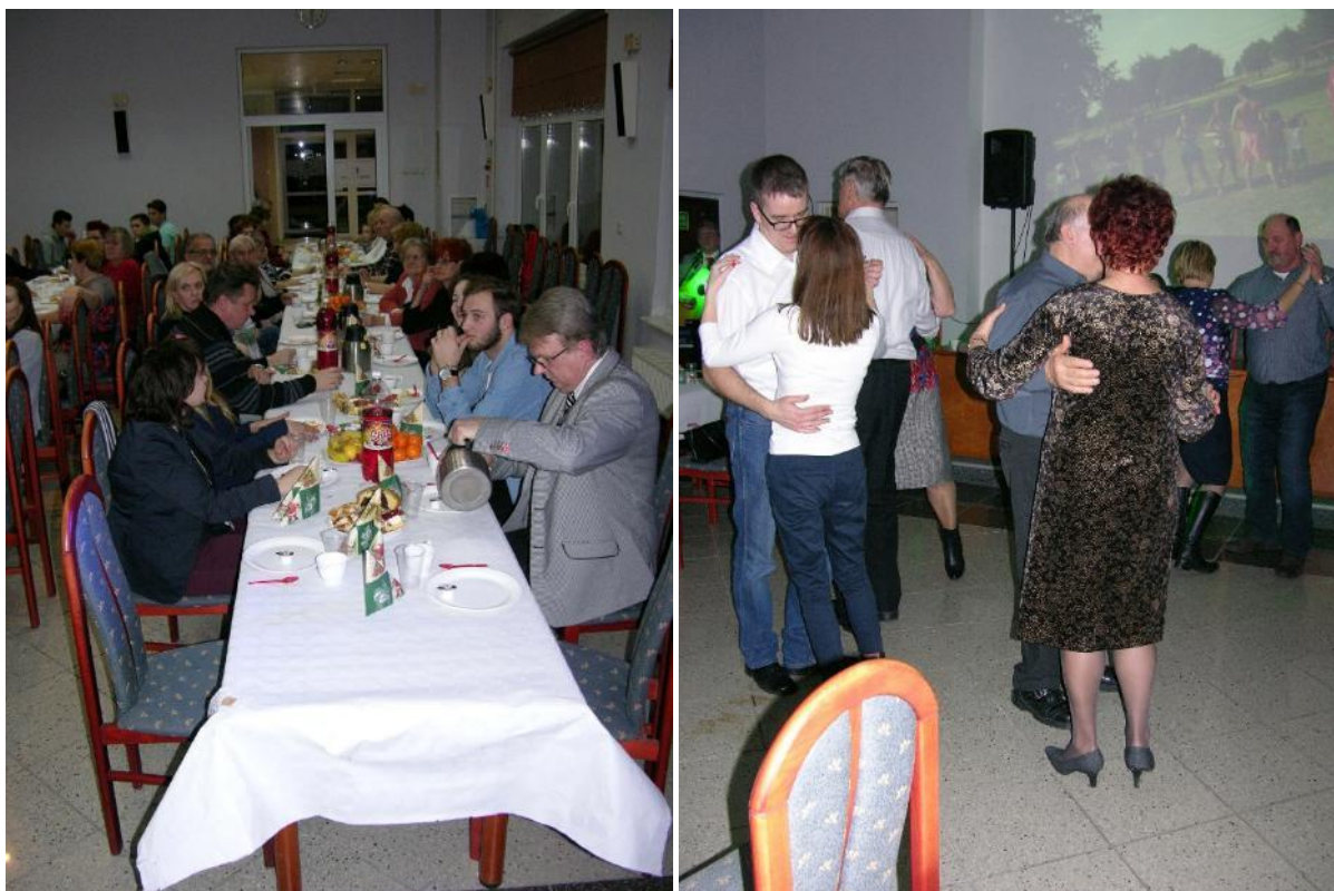
Zdjęcie 22 Spotkania świąteczno-noworoczne organizowane na sali konferencyjnej KPODR . (Rok 2016-2018)