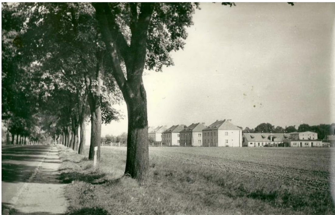
Zdjęcie 4 Widok na czworaki, z DK 10 w kierunku Bydgoszczy, po lewej stronie drogi nieistniejące już zabudowania. Rok 1966.