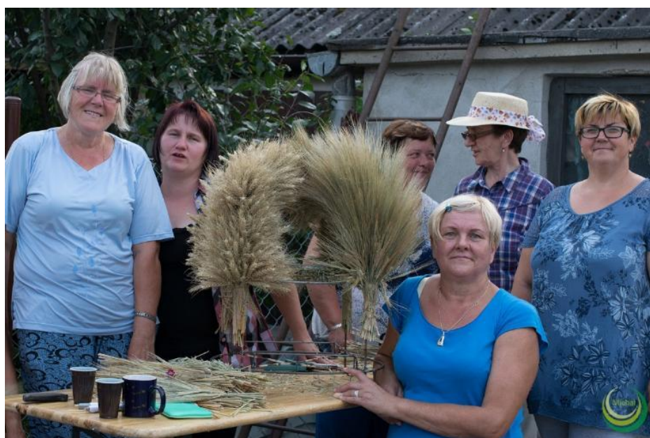
Zdjęcie 24 Przygotowanie wieńca przez KGW w Minikowie (2017 rok).