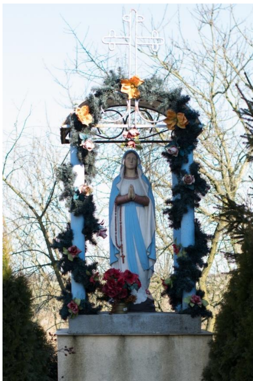
Zdjęcie 31 Figura Matki Boskiej postawiona pomiędzy blokami nr 16 i 17.