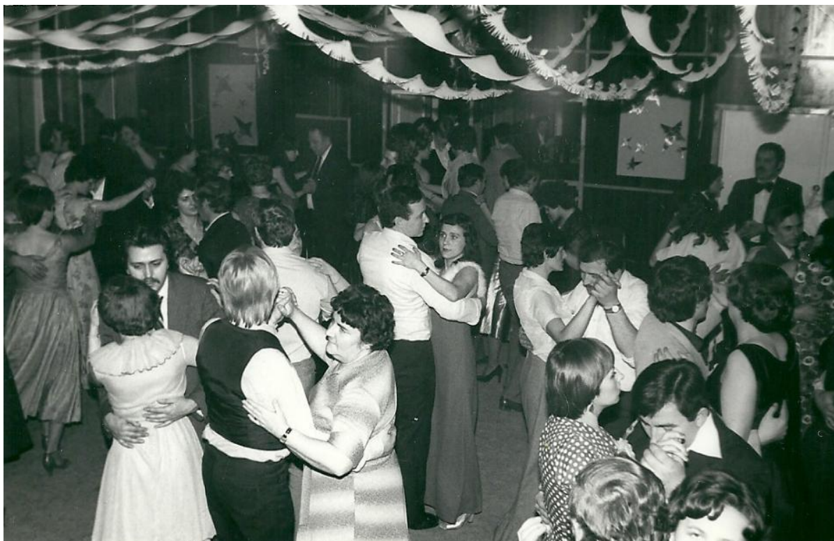
Zdjęcie 10 Zabawa w klubokawiarni. (Rok 1984)