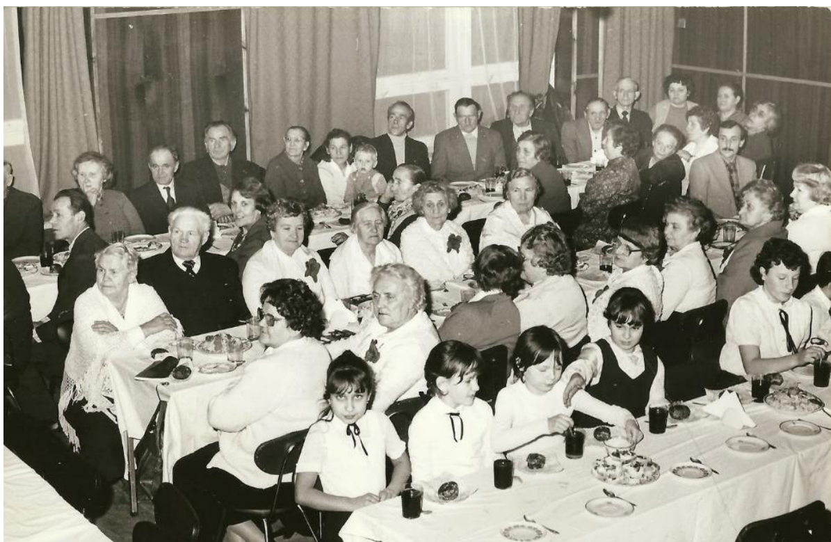
Zdjęcie 11 Dzień babci i dziadka w klubokawiarni. (Rok 1984)