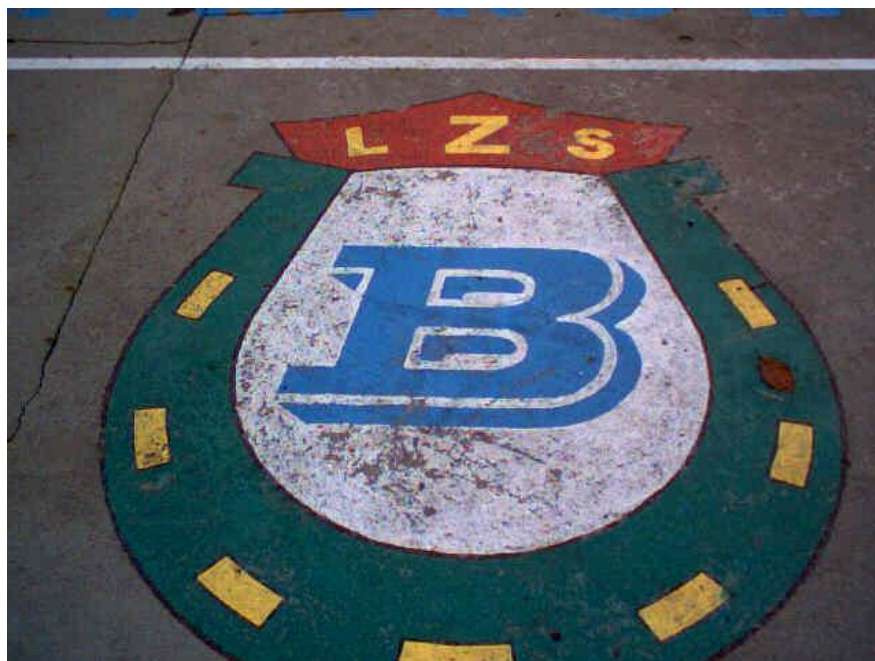
Zdjęcie 14 Logo LZS Minikowo. (Rok 2003)