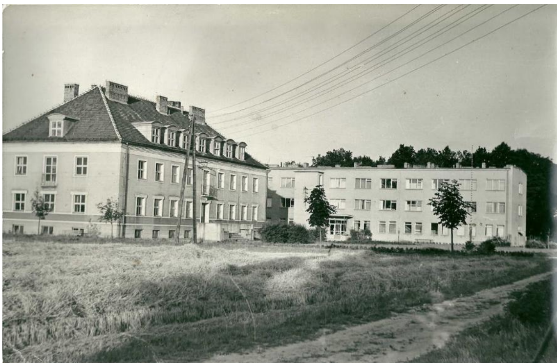
Zdjęcie 2 Widok na biurowiec RRZD i internat dla pracowników zakładu (około 1963 roku).

W 1972 r. RRZD w Minikowie przejmuje od IUNG w Puławach doświadczalnictwo terenowe, a w 1973 roku doszły zadania z zakresu wiejskiego gospodarstwa domowego. W latach 1956-1968 oprócz działalności statutowej zrealizowano szereg inwestycji m.in. oddano do użytku biurowiec Ośrodka, internat (obecnie PFHBIPM RO Bydgoszcz) na 70 miejsc noclegowych ( Zdjęcie 2 ), pobudowano dwa budynki mieszkalne, a także założono pięciohektarowy sad doświadczalny wg projektu prof. Szczepana Pieniążka. Po reformie administracyjnej kraju w 1975 roku, decyzją Wojewody Bydgoskiego Rolniczy Rejonowy Zakład Doświadczalny zostaje przekształcony w Wojewódzki Ośrodek Postępu Rolniczego. 2