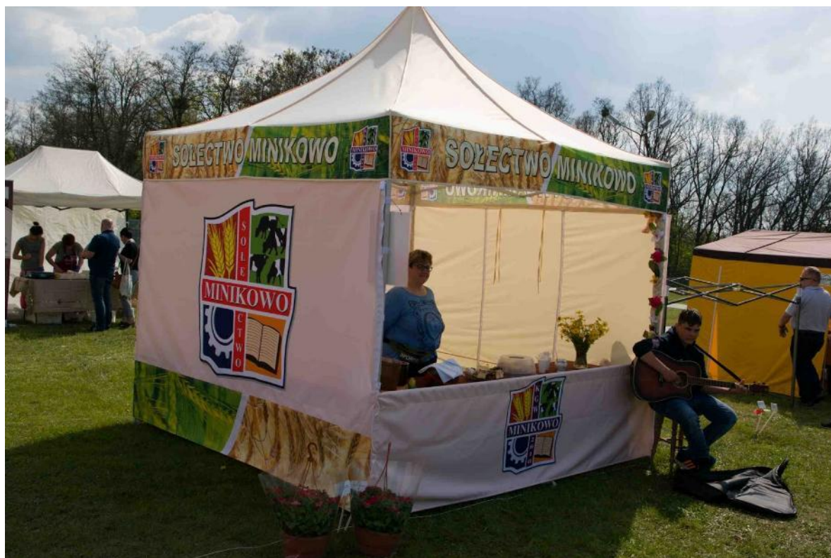
Zdjęcie 20 Namiot z logo Sołectwa Minikowo, zakupiony z funduszu sołectkiego. (Rok 2017)