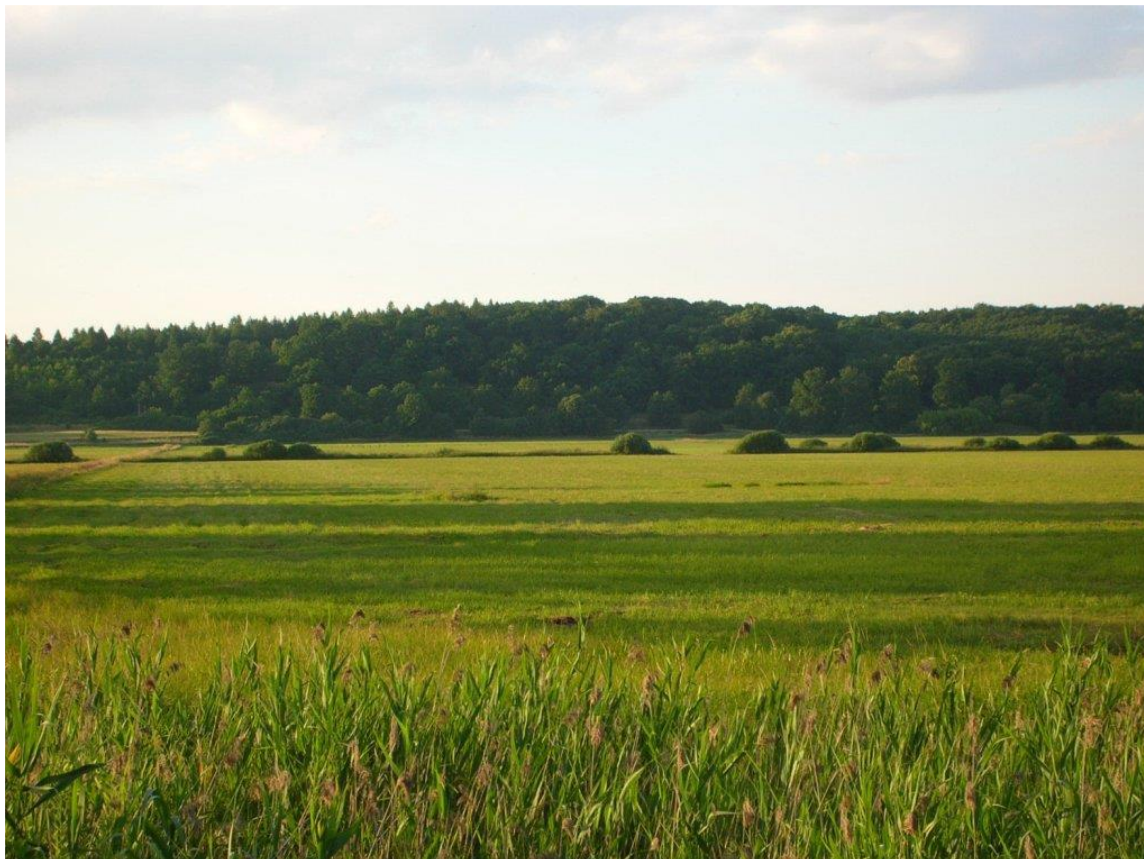
Zdjęcie 27 Widok z łąk na Las Minikowski.

Rezerwat leśny o powierzchni 45,14 ha utworzony został w roku 2001. Ochronie podlega układ żyznych lasów liściastych porastających zbocza Pradoliny Toruńsko – Eberswaldzkiej, z udziałem pomnikowych okazów dębów i lip. Jest to jeden z nielicznych kompleksów leśnych o cechach naturalnych (zróżnicowanej strukturze gatunkowej, wiekowej i przestrzennej drzewostanu) na omawianym terenie. Na uwagę zasługuje niezwykle urozmaicona rzeźba terenu z licznymi jarami i wyniesieniami.