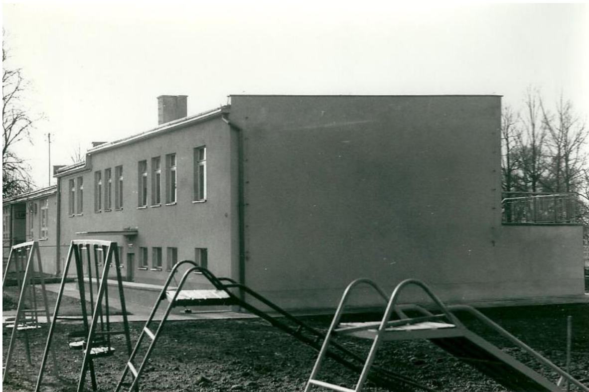
Zdjęcie 9 Widok na nowo otwarte przedszkole, w dalszej części budynku znajdowała się klubokawiarnia – obecnie znajduje się tu część konferencyjno-hotelowa KPODR . (Rok 1985)

Ostatnią inwestycją dla mieszkańców naszej wsi była rozbudowa przedszkola. Powstał nowoczesny oddział przedszkolny. 11 listopada 1985 roku uroczyście otwarto nowo rozbudowane przedszkole kosztem 17 mln zł, z przedszkola korzysta już 36 dzieci.