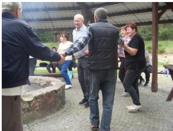
Zdjęcie 26 Wyjazd na grzybobranie i ognisko PZERiI. (2017 rok).