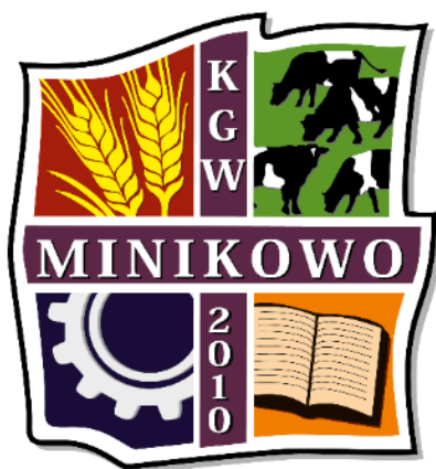
Zdjęcie 23 Logo KGW w Minikowie.