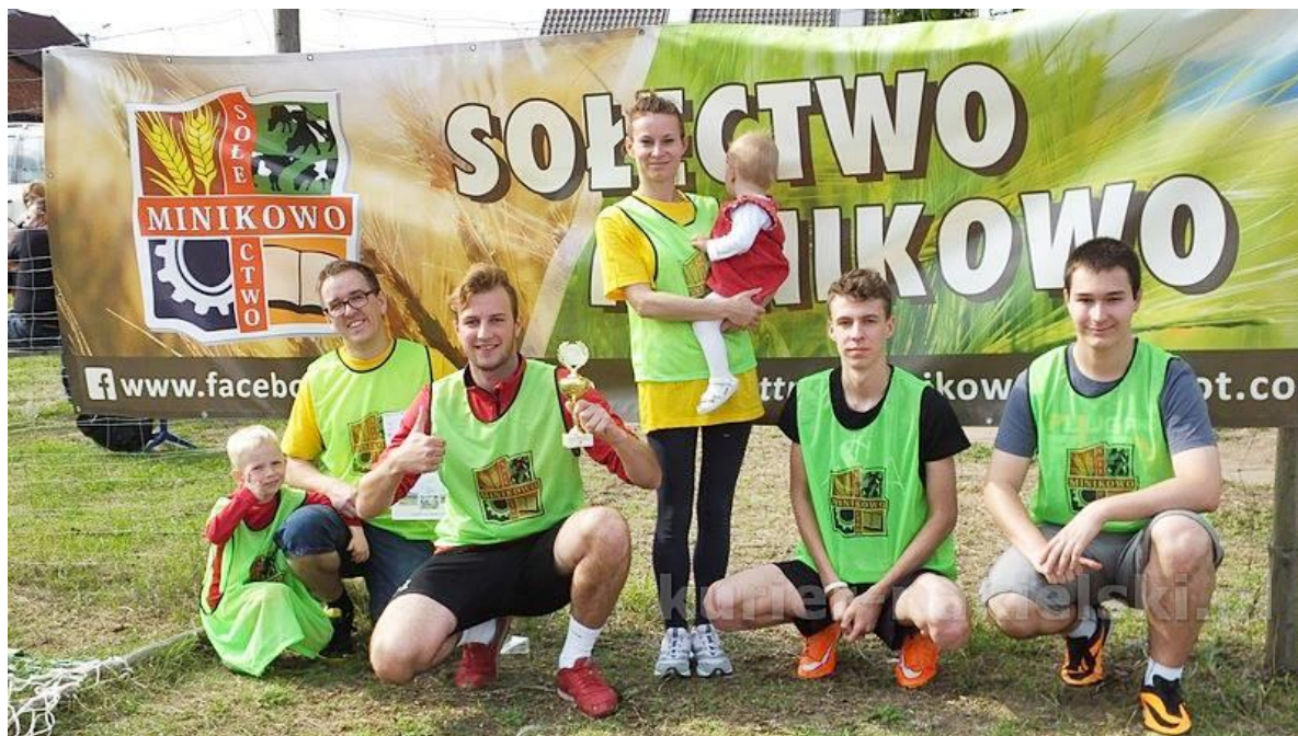
Zdjęcie 19 Baner i plastrony z logo Sołectwa Minikowo. (Rok 2015)

Dzięki logo nasza wieś staje się rozpoznawalna na turniejach, młodzież używa plastronów, grając w piłkę nożną. Mamy także swój baner, a później namiot z logiem (od 2017 roku), z którego korzystają Panie z KGW w Minikowie na wszelakich targach i wystawach kulinarnych.