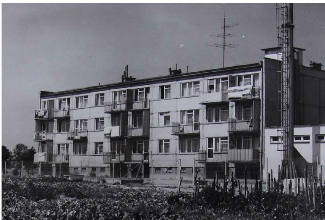
Zdjęcie 8 Nowo oddane bloki osiemnastorodzinne. (Rok 1982)