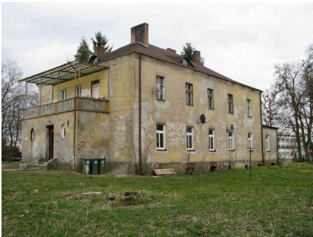
Zdjęcie 29 Budynek Pałacu.