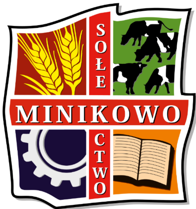
Zdjęcie 18 Logo Sołectwa Minikowo. (Rok 2015)