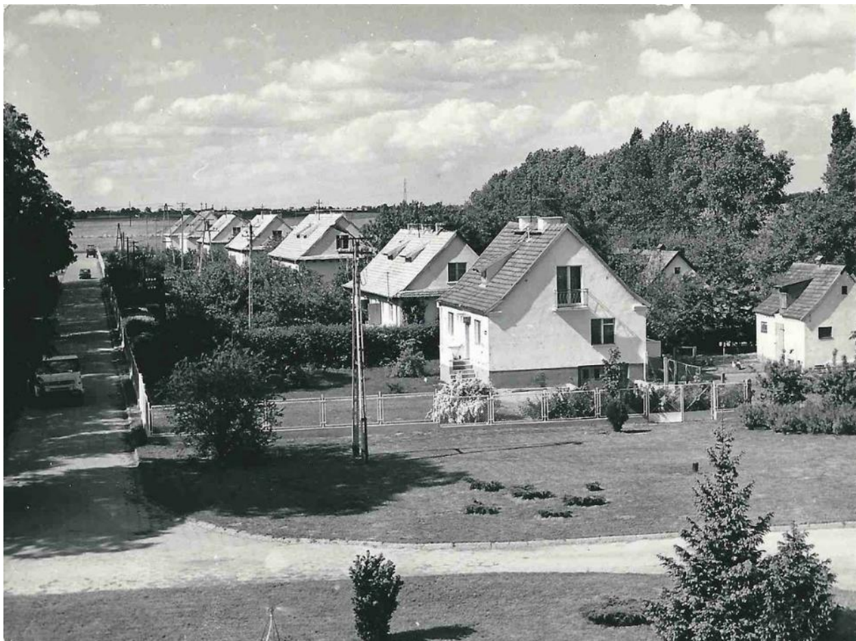
Zdjęcie 3 Widok na domki na „KOREI” (około 1978 roku).

W związku z tym, nastąpiło zapotrzebowanie na mieszkania dla pracowników. Pierwsze powstały mieszkania na KOREI 3 (Zdjęcie 3), dla dyrekcji i kierowników zakładu.