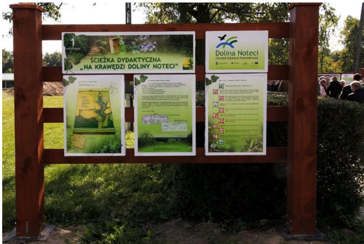
Zdjęcie 32 Tablica informacyjna dotycząca ścieżki „Na krawędzi doliny Noteci”

W październiku 2013 KPODR w Minikowie oddał do użytku ścieżkę dydaktyczną niedaleko swej siedziby, wiodącą przez rezerваты "Hedera" i "Las Minikowski". Trasa ścieżki prowadzi przez tereny włączone do sieci Natura 2000 oraz obok pomników przyrody. Ścieżka została tak wytyczona, by znalazły się na niej nie tylko najcenniejsze rośliny dzikie, ale także pola uprawne, czy stary sad, w którym zlokalizowano punkt widokowy. Dla gości przygotowano liczne tablice informacyjne oraz publikacje z informacjami przyrodniczymi. Punkt widokowy daje możliwość podziwiania panoramy łąk ślesińskich. Jesienią ten teren często jest miejscem krótkiego wypoczynku migrujących ptaków. Planując szlak ścieżki dydaktycznej pracownicy ODR w Minikowie uwzględnili na niej także problematykę gatunków szkodliwych roślin inwazyjnych, występujących w Polsce. Najokazalszym ich przedstawicielem jest licznie spotykany w tej części regionu kujawsko-pomorskiego barszcz Sosnowskiego, przykład, jakie niebezpieczeństwo niesie wprowadzanie obcych gatunków i jak istotna jest ochrona rodzimej fauny i flory.