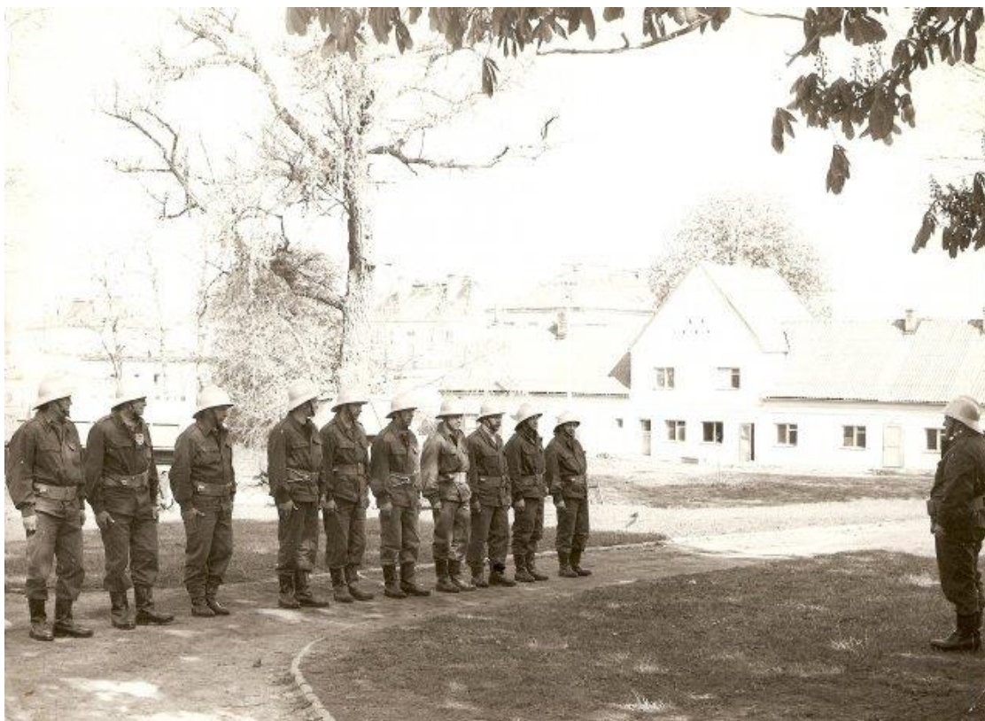
Zdjęcie 13 Przykładowa Ochotnicza Straż Pożarna. W tle nieistniejący budynek pomiędzy dwoma stawkami. (Rok 1978)