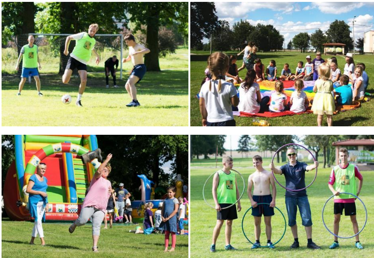
Zdjęcie 21 Wakacyjny festyn „Dzień Minikowa” – plastrony z logiem sołectwa. . (Rok 2017)

Od 2014 roku organizowany jest coroczny Festyn „Dzień Minikowa”. Organizowane są konkursy dla najmłodszych, także dla starszych, ale także kontynuujemy tradycję, czyli mecz w nogę Kawalerowie-Żonaci.