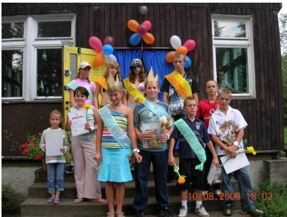
Zdjęcie 16 Wyjazd dzieci z Minikowa do Kopernicy – wybory miss mistera. (Rok 2006)