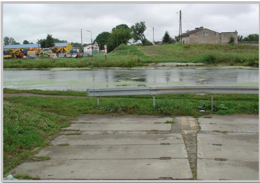
Rysunek 9. Lokalizacja kładki nad rzeką Noteć.