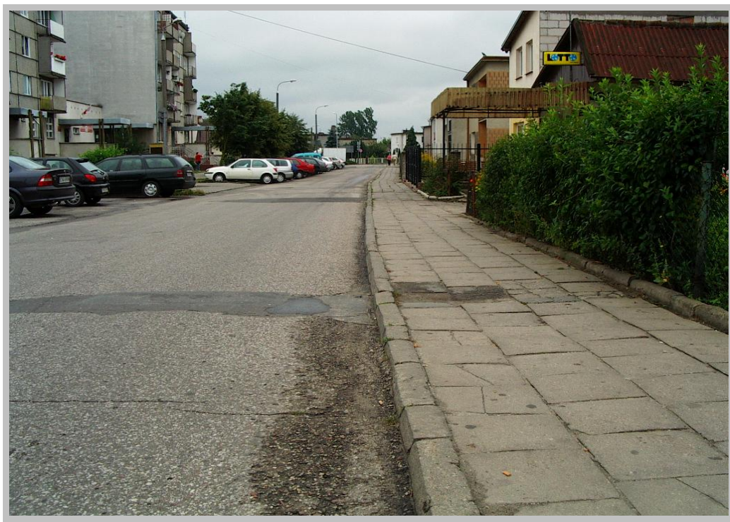
Rysunek 7. Stan obecny chodników i dróg na osiedlu Chrobrego.