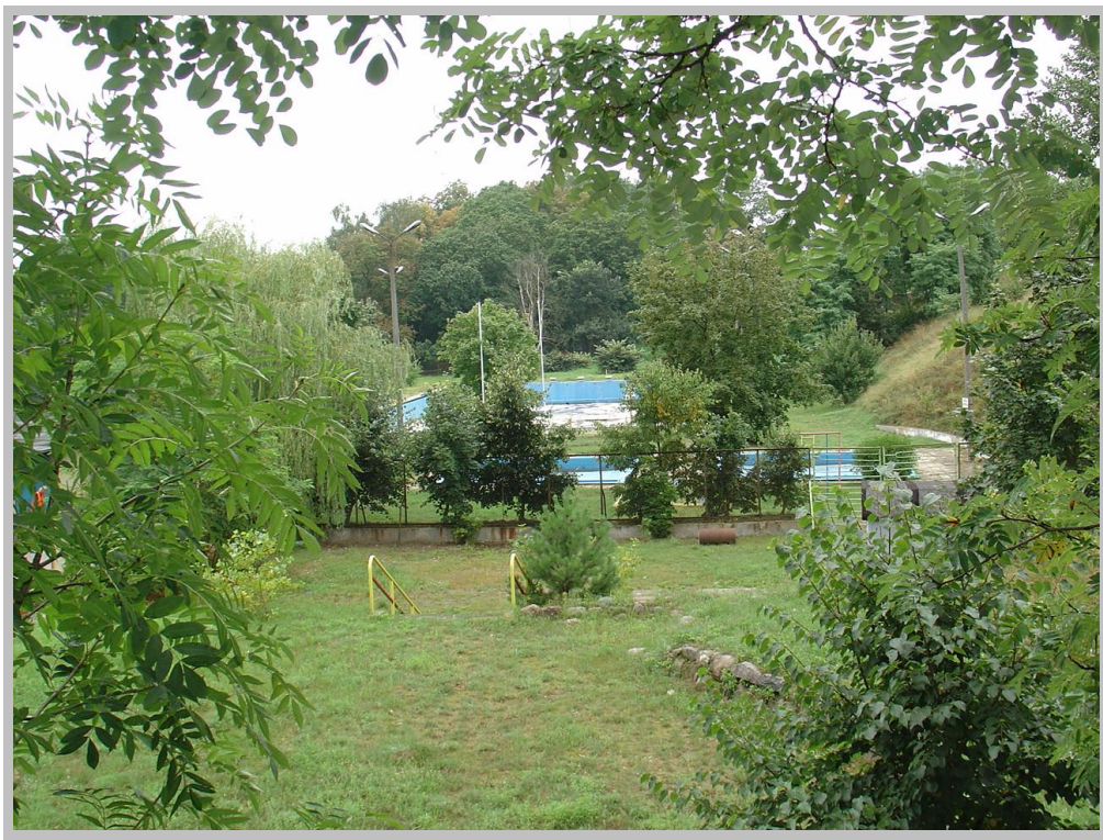
Rysunek 2. Pływalnia w Nakle nad Notecią (widok 2).