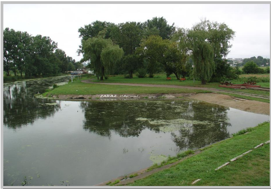
Rysunek 8. Teren nakielskich łaźniek.