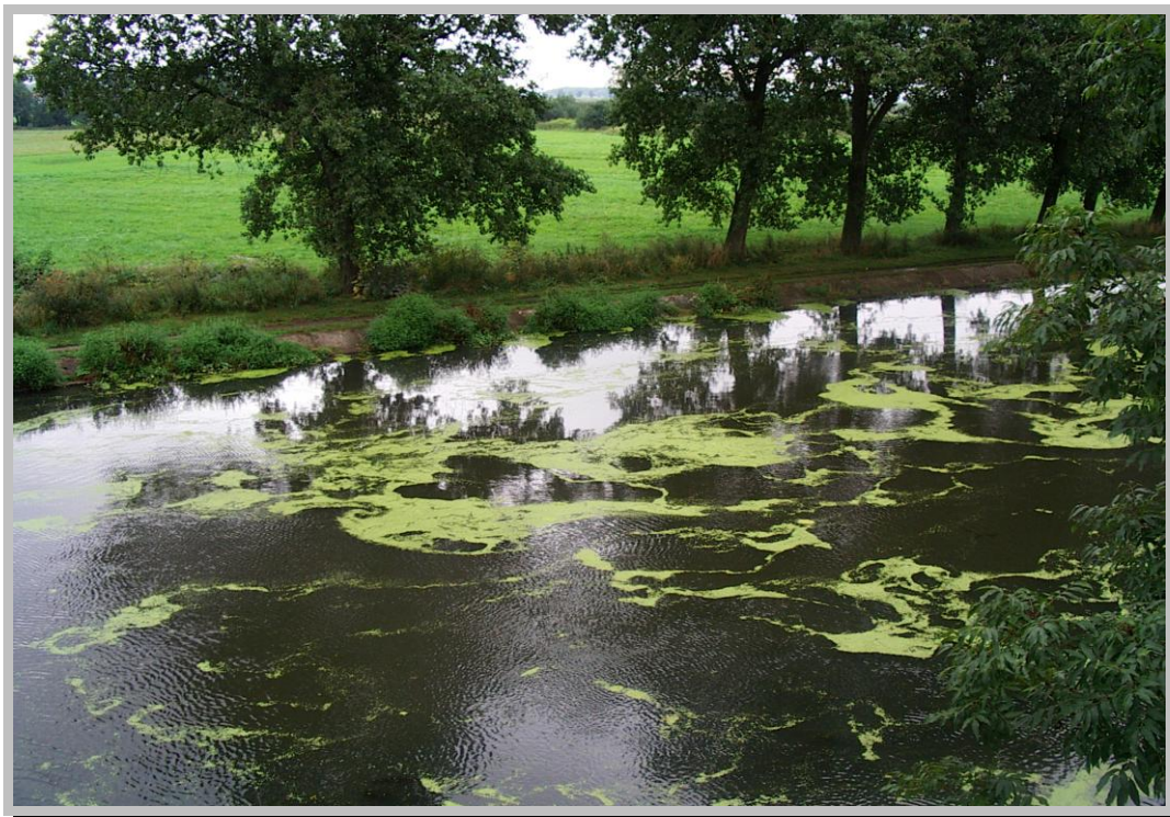
Rysunek 10. Planowany teren budowy mariny i pomieszczeń dydaktycznych (widok 1).