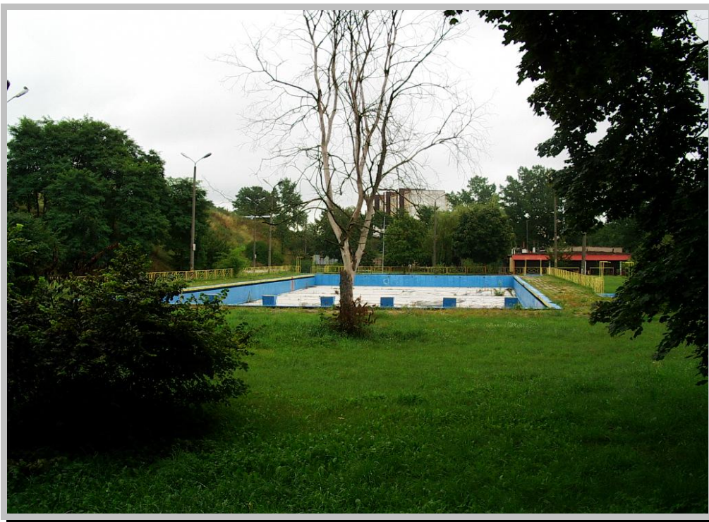
Rysunek 1. Pływalnia w Nakle nad Notecią (widok 1).