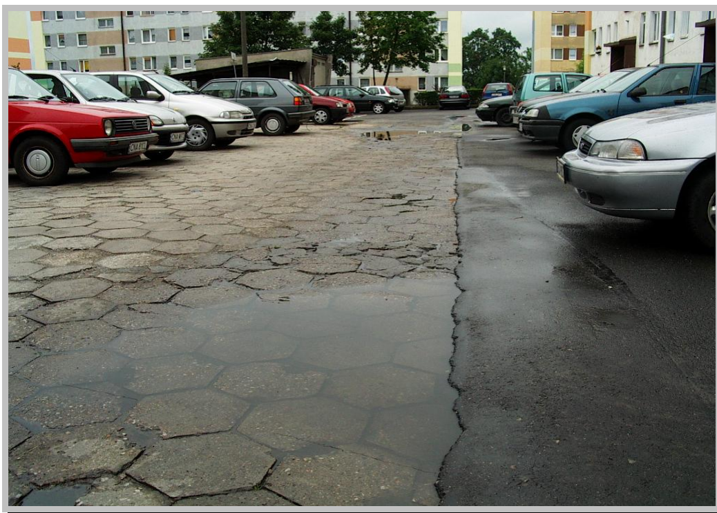
Rysunek 6. Droga na osiedlu Chrobrego.