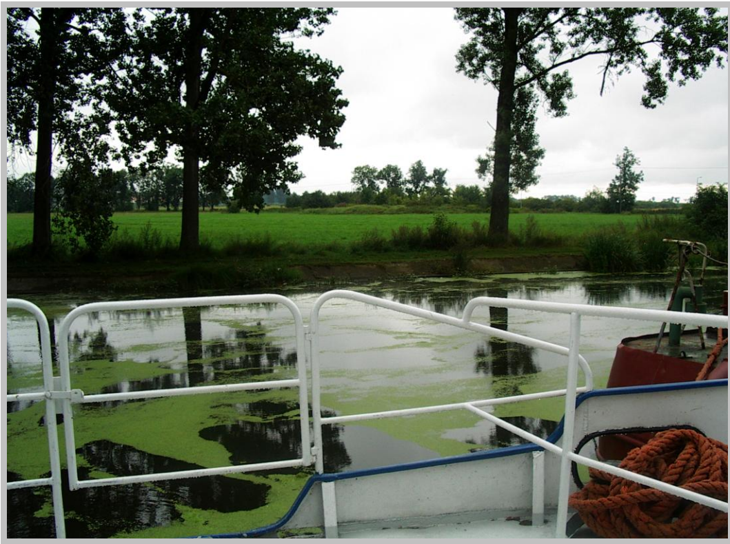
Rysunek 11. Planowany teren budowy mariny i pomieszczeń dydaktycznych (widok 2).