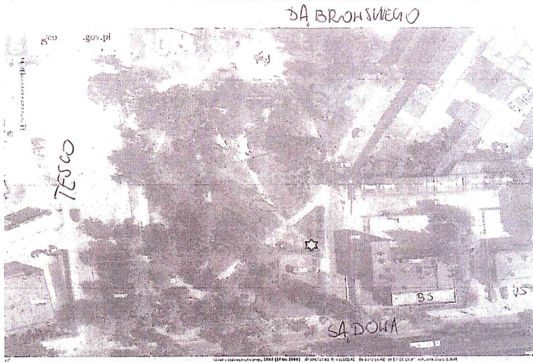
Ryc. 1. Planowana lokalizacja automatycznej stacji monitoringu powietrza w Nakle nad Notecią.