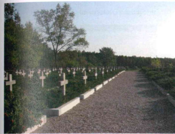
Cmentarz, na którym spoczywają zmarli w latach 1941 – 1945.

Spośród 1297 osób zmarłych w obozie w Potulicach, których nazwiska ustalono, 767 to dzieci. Od 1943 roku utworzono dla nich specjalny oddział. Pojawiła się wówczas nazwa „Ostjugendbewahrlager Potuliz”