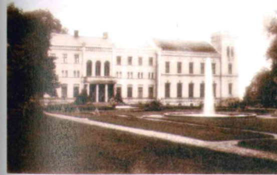
Pałac, w którym mieściło się seminarium, szkoła podoficerów SS, stary obóz, a w jego piwnicach karcer (bunkier).

Z początkiem 1940 roku w pomieszczeniach pałacowych zorganizowano szkołę dla podoficerów SS, a w lecie tego samego roku pałac został opróżniony. Początkowo w pałacu potulickim zlokalizowano obóz zbiorczy o nazwie Sammellanger Schloss Potulitz. Później nazwę Potulitz zamieniono na Lebrechtsdorf.