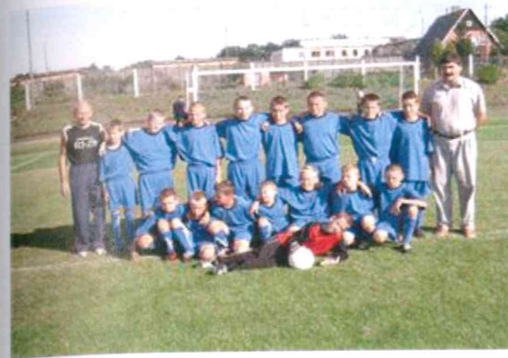
Grupa młodzieżowa piłki nożnej.