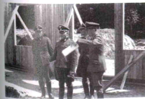
Inspekcja budowy obozu przez władze niemieckie.

Baraki budowano siłami więźniów sprowadzonych z obozu koncentracyjnego w Stutthofie, wykwalifikowanych rzemieślników i fachowców.