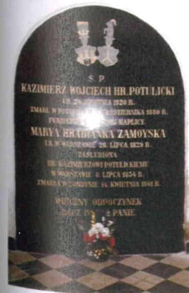
Tablica nagrobna w krypcie kaplicy.