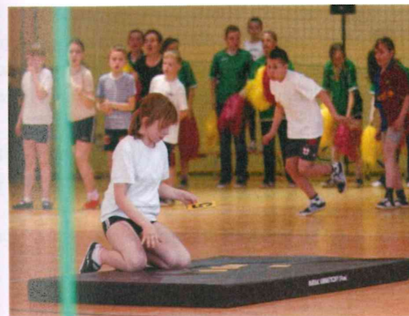
Gminne zawody sportowe „Pluszowy Miś”.

Ważną funkcję w życiu naszej miejscowości odgrywa Zespół Szkół im. „Dzieci Potulic”. W skład zespołu wchodzi: Szkoła Podstawowa i Gimnazjum nr 2. Ogółem w szkole uczy się 220 uczniów. Placówka od wielu lat jest opiekunem miejsc pamięci narodowej oraz prowadzi szeroką działalność edukacyjną. Od roku 2006 szkoła ma podpisaną umowę partnerską ze szkołą Oberschule Elsterwerda w Niemczech. Absolwenci naszej szkoły kontynuują naukę w szkołach w Nakle i Bydgoszczy w zależności od zainteresowań.