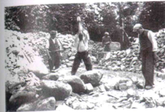
Praca przy budowie obozu.

Liczba więźniów w obozie stale rosła (wg niektórych źródeł pod koniec października 1941 roku wynosiła około 4 tys.). W związku z tym przystąpiono do budowy nowego obozu. Pierwotnie zakładano budowę dwudziestu drewnianych baraków zdolnych pomieścić 10 tys. osób lecz w trakcie budowy powiększono ich liczbę do trzydziestu.