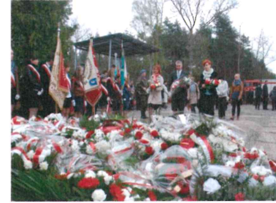
Ogólnopolskie uroczystości patriotyczne.