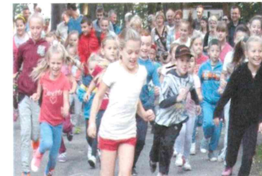
Biegi o „Zielony Liść Dębu”

W Potulicach funkcjonuje również Ochotnicza Straż Pożarna. Budynek OSP został wybudowany przez mieszkańców Potulic. Jednostka wyposażona jest w kilka samochodów oraz wóz ratownictwa medycznego. OSP posiada również dwie grupy młodzieżowe. Strażacy corocznie biorą udział w gminnych i powiatowych zawodach strażackich odnosząc sukcesy.