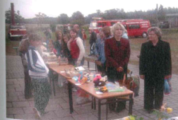
Festyn dla mieszkańców Potulic.

W związku z podziałem gruntów na działki budowlane miejscowość nasza rozbudowuje się, co w przyszłości może wpłynąć na większą liczbę mieszkańców.