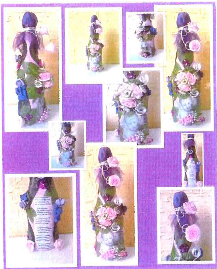
OZDOBY ARTYSTYCZNE WYKONANE PRZEZ MIESZKANKĘ MAŁOCINA