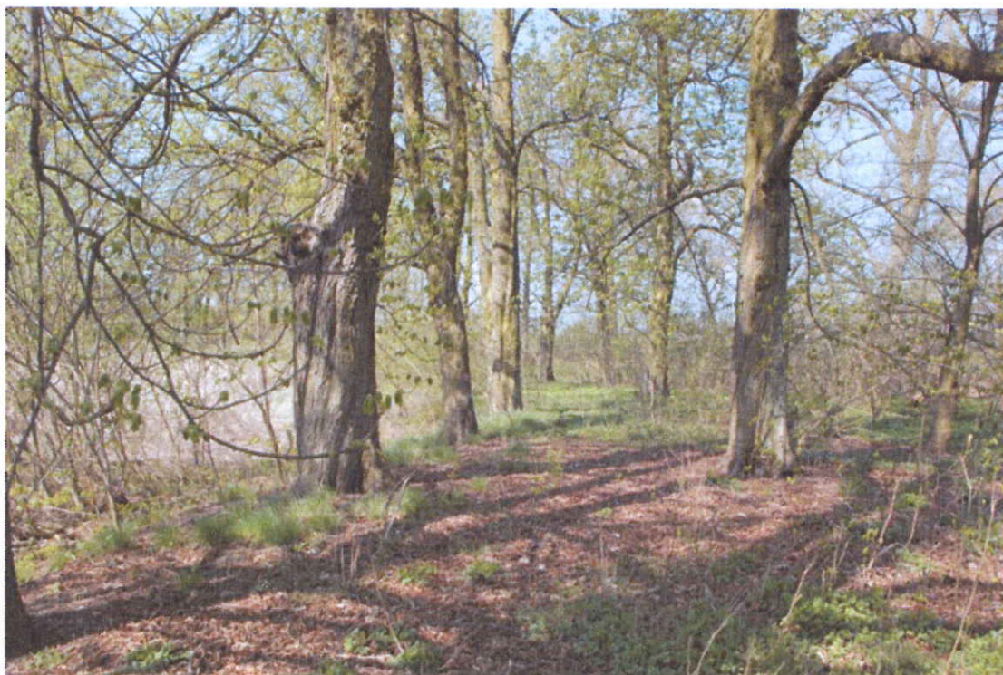
Rys. 3 Aleja drzew biegnąca wokół stawu dworskiego w parku w Gumnowicach

Byłbym szczęśliwy, ażeby spełniły się nasze marzenia.