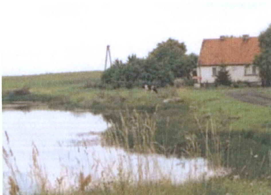
Rys. 1 Jedno z gospodarstw wiejskich w Gumnowicach

Naszą wieś wyróżnia rzetelność, pracowitość mieszkańców, dbałość społeczeństwa o swoje obowiązki, szczególnie o porządek wokół gospodarstw i o swoje środowisko naturalne. W ostatnich latach założono wiele trawników, nasadzono drzewa i krzewy ozdobne.