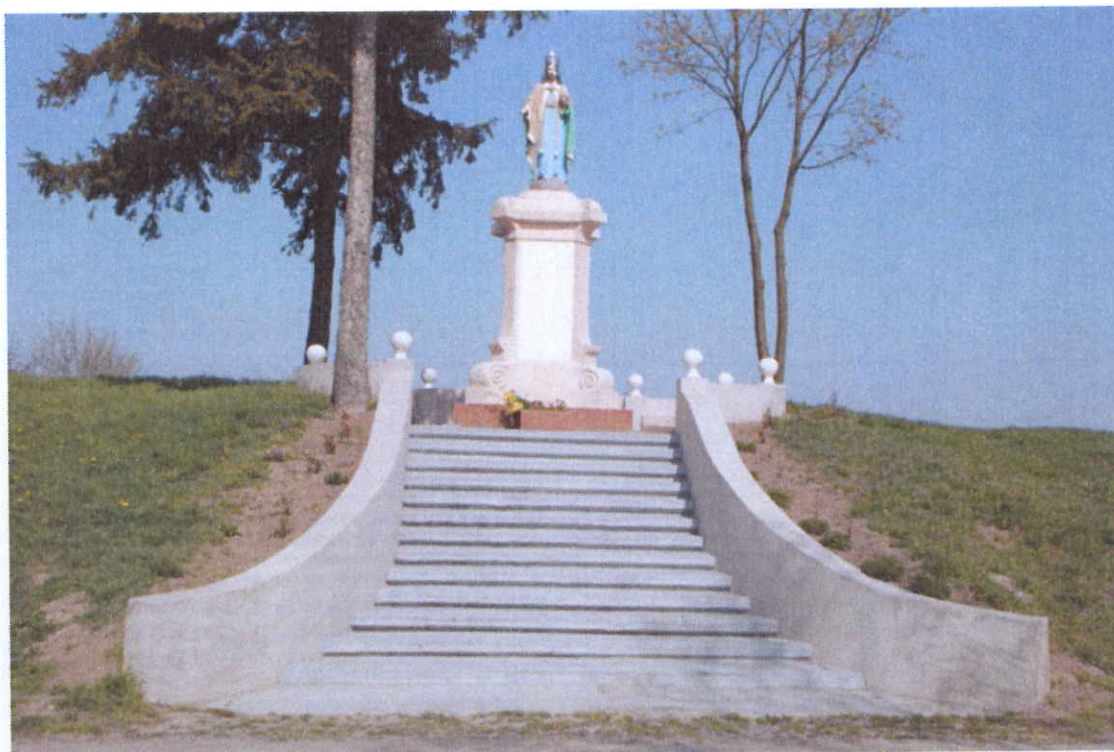
Rys. 2 Figura Chrystusa Króla w Gumnowicach

Na terenie naszej wsi znajduje się figura Chrystusa Króla, którą postawiono i poświęcono w 1927 roku w parku, który jest pozostałością po dawnych włościach.