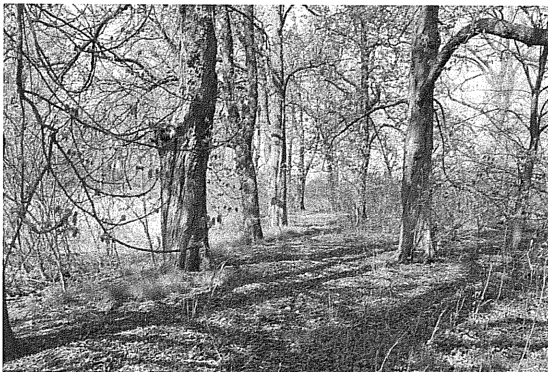
Rys. 3 Aleja drzew biegnąca wokół stawu dworskiego w parku w Gumnowicach

Byłbym szczęśliwy, ażeby spełniły się nasze marzenia.