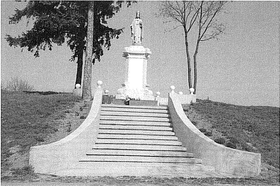
Rys. 2 Figura Chrystusa Króla w Gumnowicach

Na terenie naszej wsi znajduje się figura Chrystusa Króla, którą postawiono i poświęcono w 1927 roku w parku, który jest pozostałością po dawnych włościach.