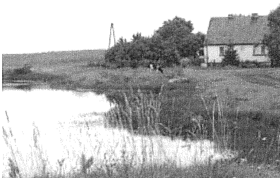
Rys. 1 Jedno z gospodarstw wiejskich w Gumnowicach

Naszą wieś wyróżnia rzetelność, pracowitość mieszkańców, dbałość społeczeństwa o swoje ojejścia, szczególnie o porządek wokół gospodarstw i o swoje środowisko naturalne. W ostatnich latach założono wiele trawników, nasadzono drzewa i krzewy ozdobne.